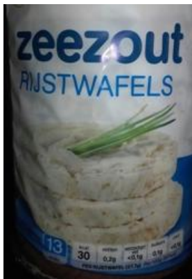
.....lekker en licht verteerbaar.....